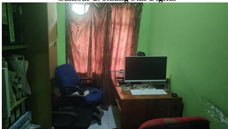
Gambar 2. Ruang Staf Digital

Namun dari hasil penelitian, saranan prasarana yang ada di kantor Desa Padang Jaya masih kurang mendukung karena hanya tersedia satu komputer dan satu ruangan untuk staf digital, dimana diruangan tersebut akses jaringan masih kurang stabil, dalam ruangan tersebut juga masih tergabung dengan beberapa berkas arsip. Berikut ini adalah ruangan staf digital yang ada Didesa Padang Jaya: